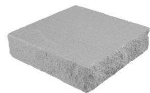
Cubrepilar split esquina 40 x 45