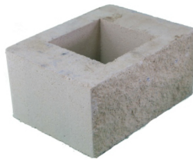
Pilar split dos caras lisas 30 x 40