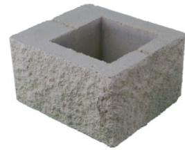
Pilar split esquina 30 x 35