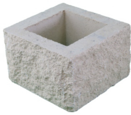
Pilar split cuatro caras 30 x 30