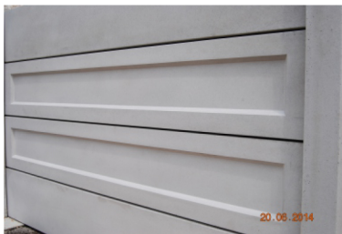
Placa LISA Placa CLASICA