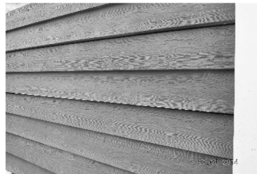
Placa 2 TABLAS