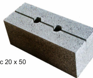
Pescabloc 20 x 50