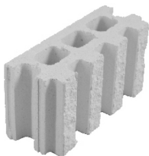
Bloque R4 15 x 40