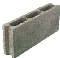
Bloque normal 9 x 50