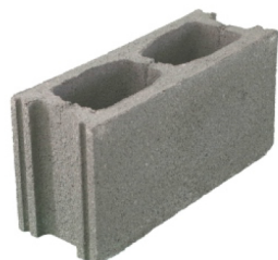
bloque normal 15 x 40