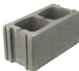
bloque normal 20 x 40