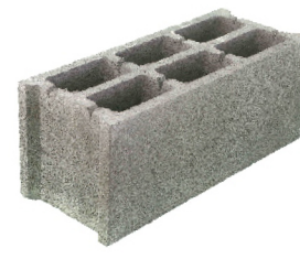
Bloque normal 20 x 50 (2C)