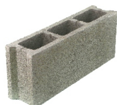
bloque normal 12 x 50