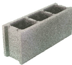
Bloque normal 15 x 50