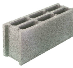
Bloque normal 15 x 50 (2C)