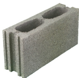
Bloque normal 12 x 40