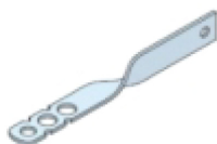
llave de atado SXS TWIST