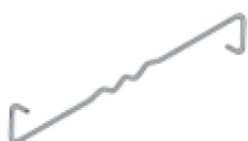
Llave de atado para pared de doble hoja