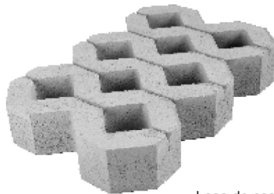
Losa de cesped de 10 x 60 x 40