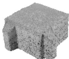
Eco-adoquin cuadrado 16 x 16