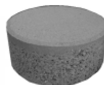
Eco-adoquin redondo diametro 25