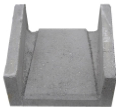
Bajante de hormigón de 50 x 50