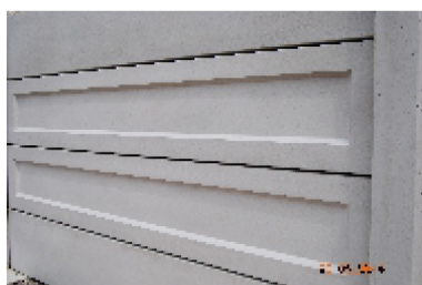
Placa LISA Placa CLASICA