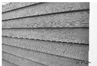
Placa 2 TABLAS